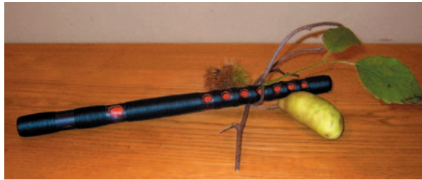
年中行事・楽 (大田・枝川・松田)

年中行事の場であった家庭や村社会は次第に解体され、核家 族化が進み、日本の生活文化が忘れ去れようとしています。 私達は、先人が大切に育んできた年中行事の由来や意味を知り、 季節の収穫物に感謝し、自然とのつながりを大切にしながら、 多くの人と楽しみ、広めていきたいと願っているグループです。